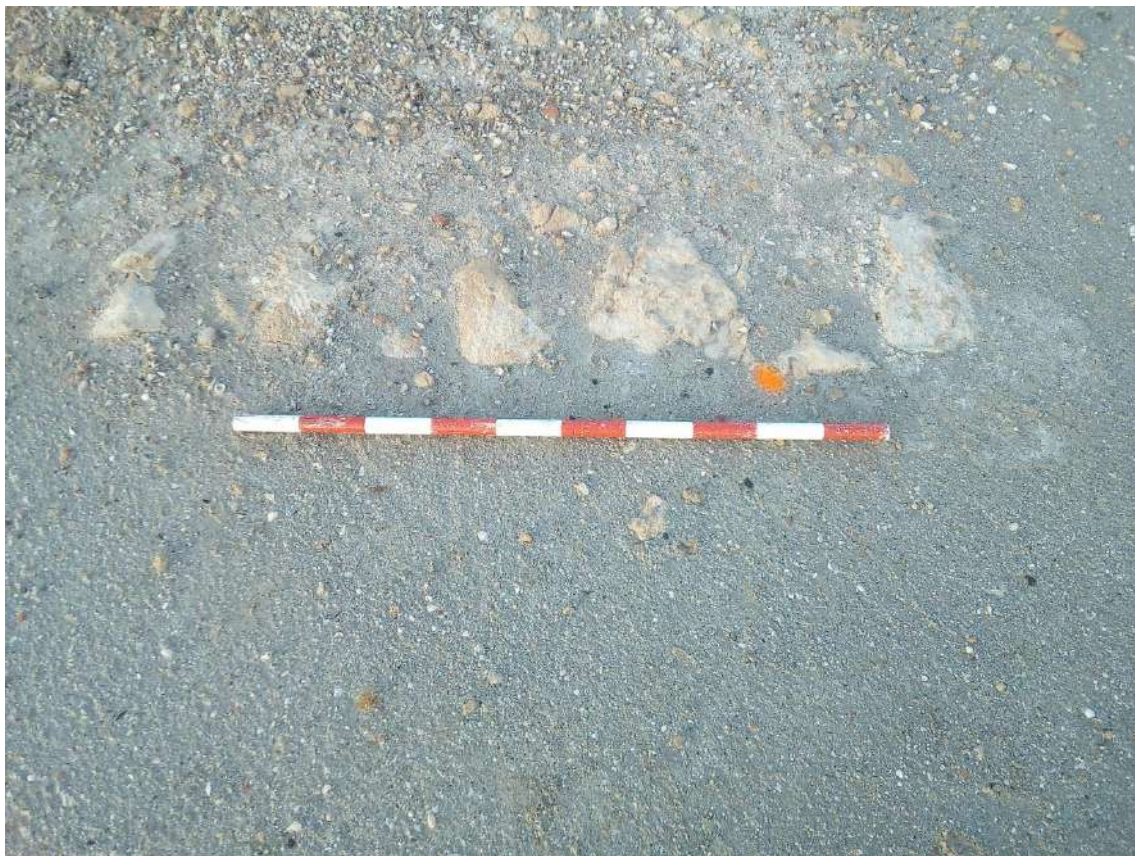
Fig.7.- Restos de estructura en la zona donde estaría ubicada la Torre.