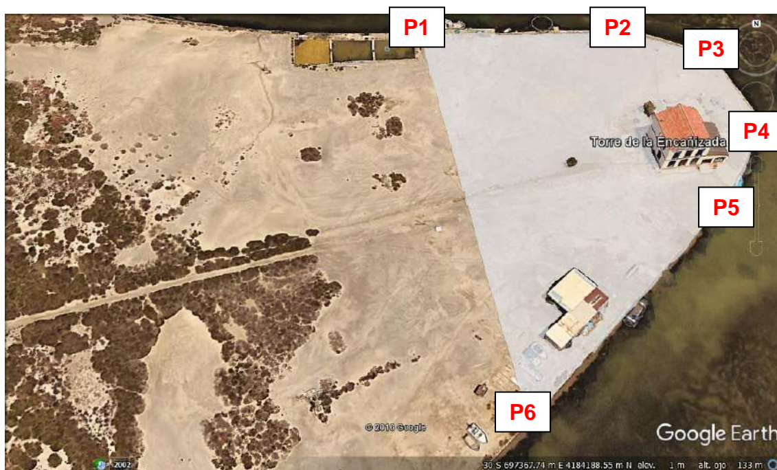
Fig. 2.- Delimitación del Área inicial a prospectar