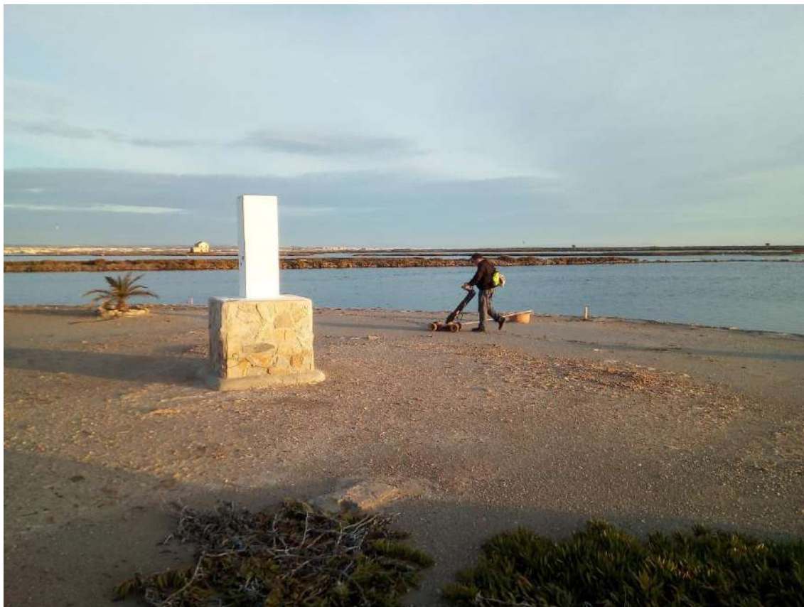
Fig.11.- Técnico pasando el Georadar