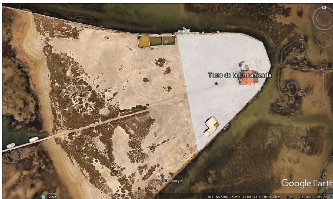
Fig.3.- Superficie total de la isleta de la Encañizada

Aunque finalmente, y estando sobre el terreno, se prospectó toda la superficie de la isleta, con el fin de localizar otras posibles estructuras o infraestructuras asociadas a la actividad pesquera tradicional de la Encañizada de la Torre (Fig.3)