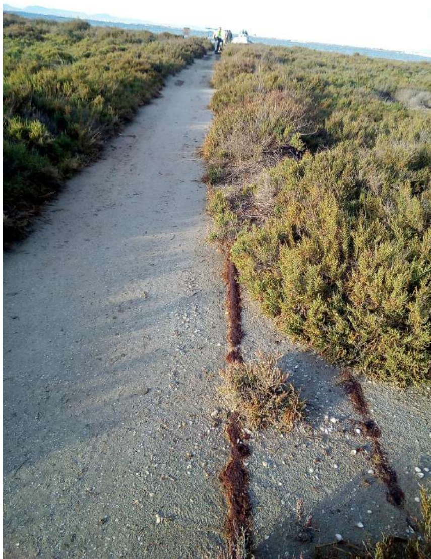
Fig.9.- Restos de vías metálicas para transporte del pescado