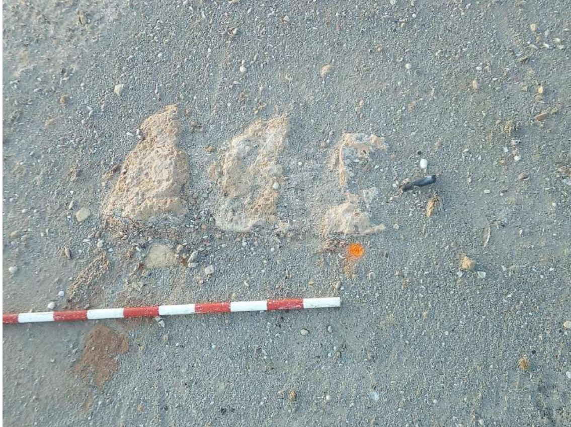
Fig.6.- Restos de estructura en la zona donde estaría ubicada la Torre.