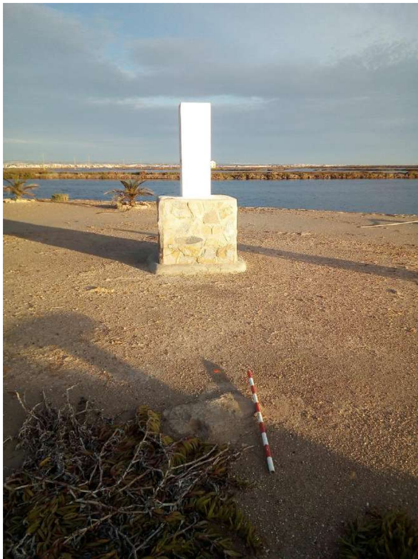
Fig.5.- Restos de estructura en la zona donde estaría ubicada la Torre.