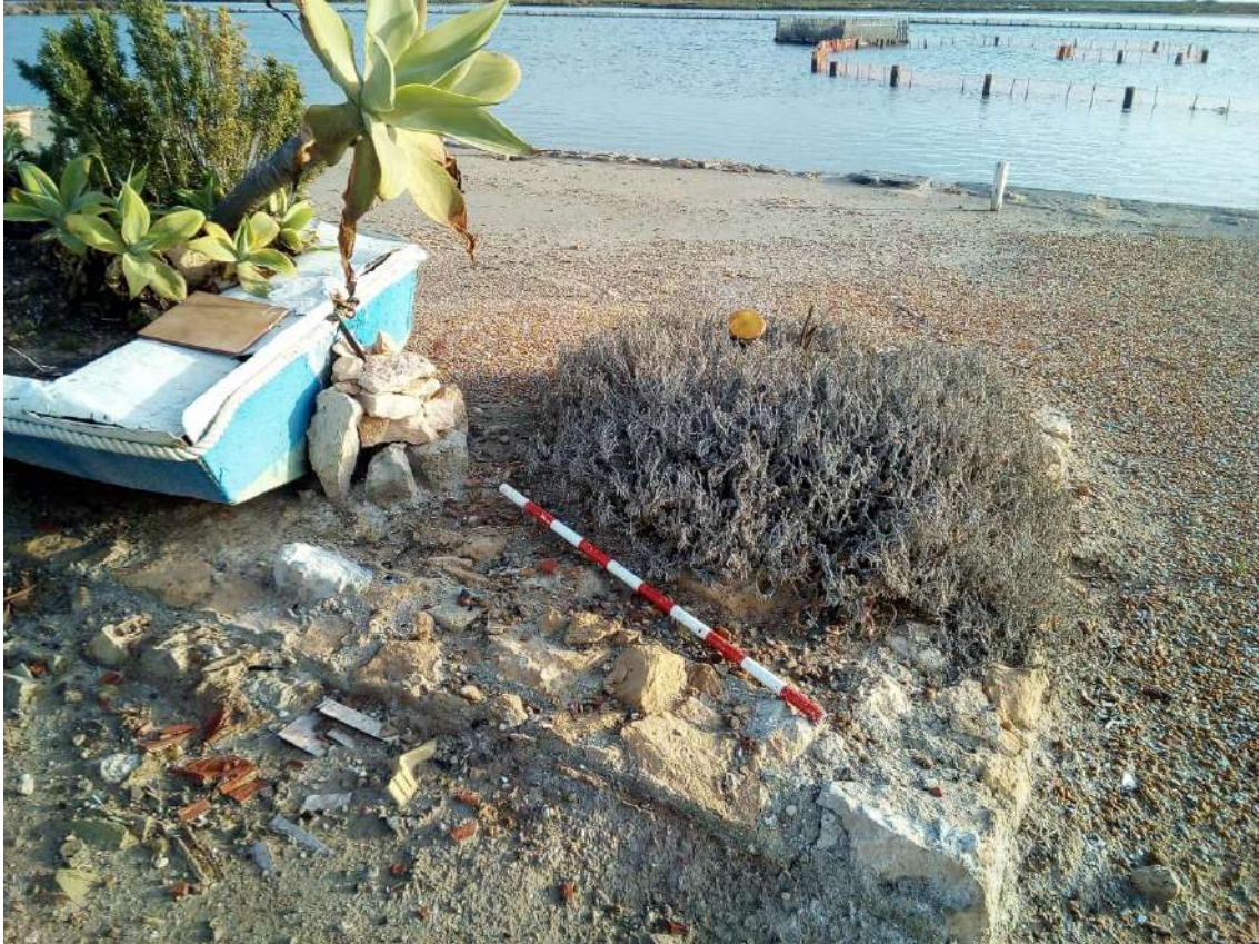
Fig.8.- Restos de estructura en zona cercana a donde estaría ubicada la Torre.